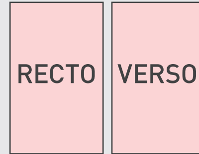
Tête de lettre verticale

Il suffit de travailler sur le calque quadri, de vous servir des repères visuels des cadres, et une fois votre maquette finalisée, masquer ou supprimer les calques de repères pour qu'ils n'apparaissent pas sur le fichier final : il doit juste y avoir les traits de coupe, et votre visuel.