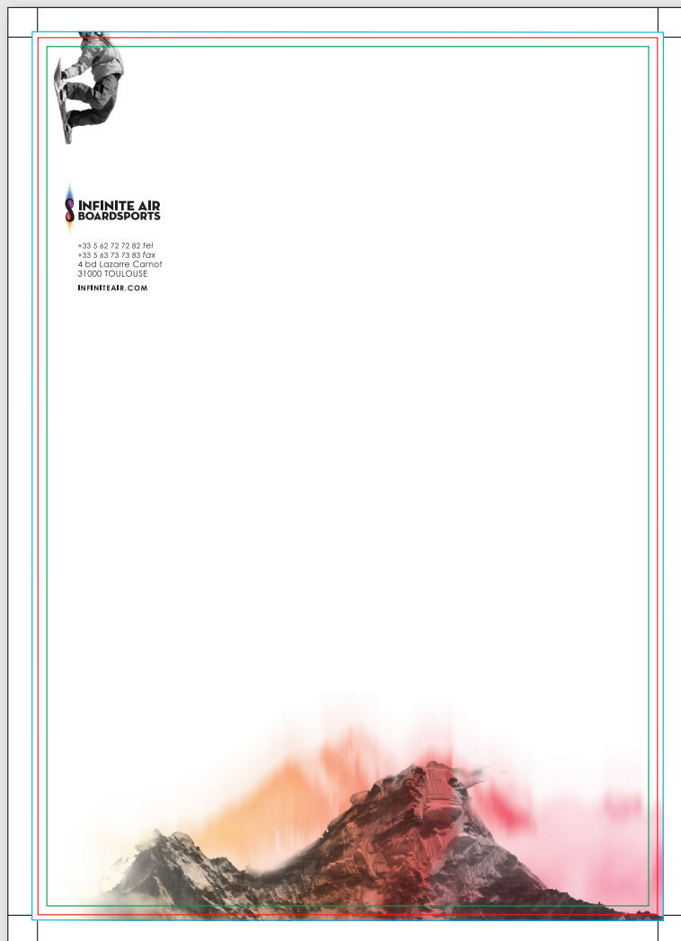
Fichier dans gabarit