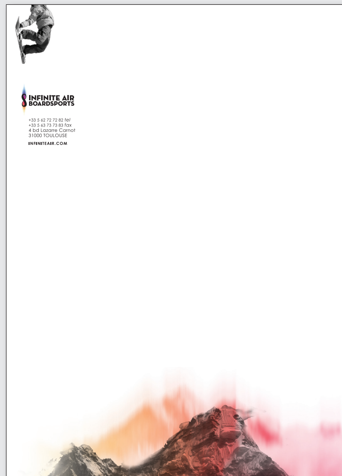
Tête de lettre imprimée