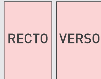
Carte verticale R°/V°

Il suffit de travailler sur le calque quadri, de vous servir des repères visuels des cadres, et une fois votre maquette finalisée, masquer ou supprimer les calques de repères pour qu'ils n'apparaissent pas sur le fichier final : il doit juste y avoir les traits de coupe, et votre visuel.