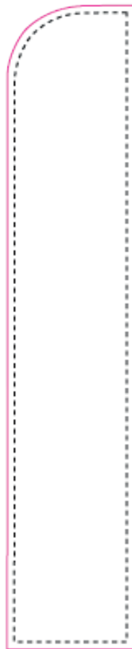
0,70x4,48m pour drapeau 0,70x5m