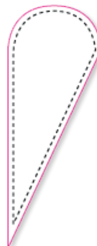
0,92x2,35m pour drapeau 0,92x3m