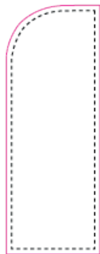
0,70x2,28m pour drapeau 0,70x3m