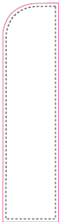
0,70x3,38m pour drapeau 0,70x4m